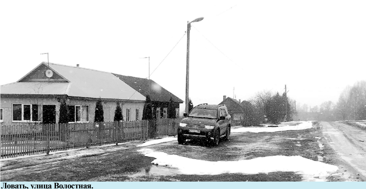
Ловать, улица Волостная.