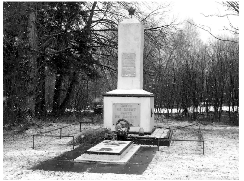
Памятник Воинам-освободителям в Ловати.

По улице Запрудной отремонтировали 300 метров дороги и по улице Заречной 250 метров. Не асфальт - но дорога есть. В этом году работы будут продолжены.