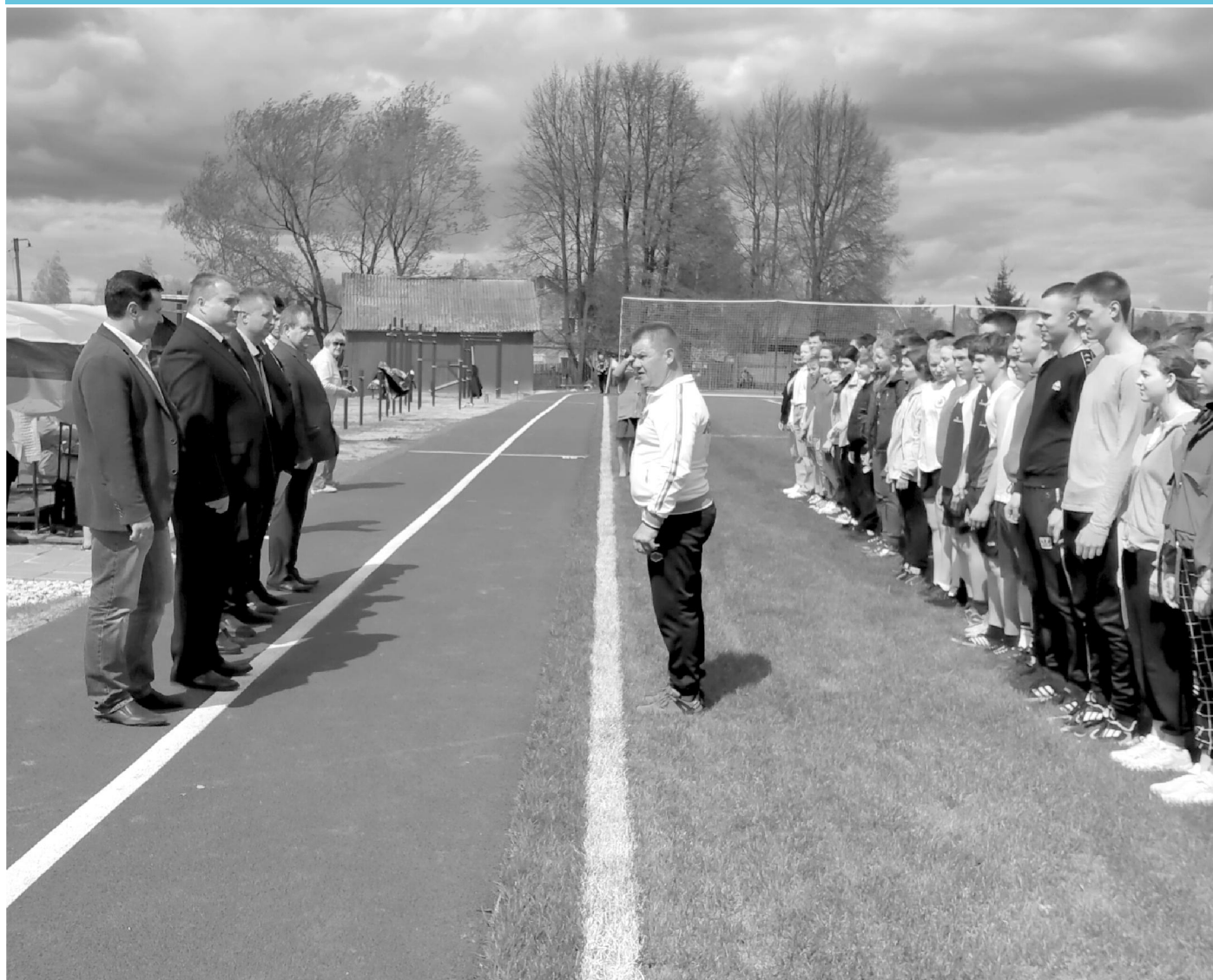
В Хвастовичской средней школе торжественно открыт новый школьный стадион. Материал о событии "К новым победам готовы!" читайте на 2-й странице номера.