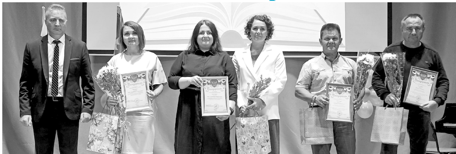
Награды - педагогам.

На протяжении двух последних лет школы района принимают участие в национальном проекте "Образование". О своём опыте участия в проекте рассказала ди-