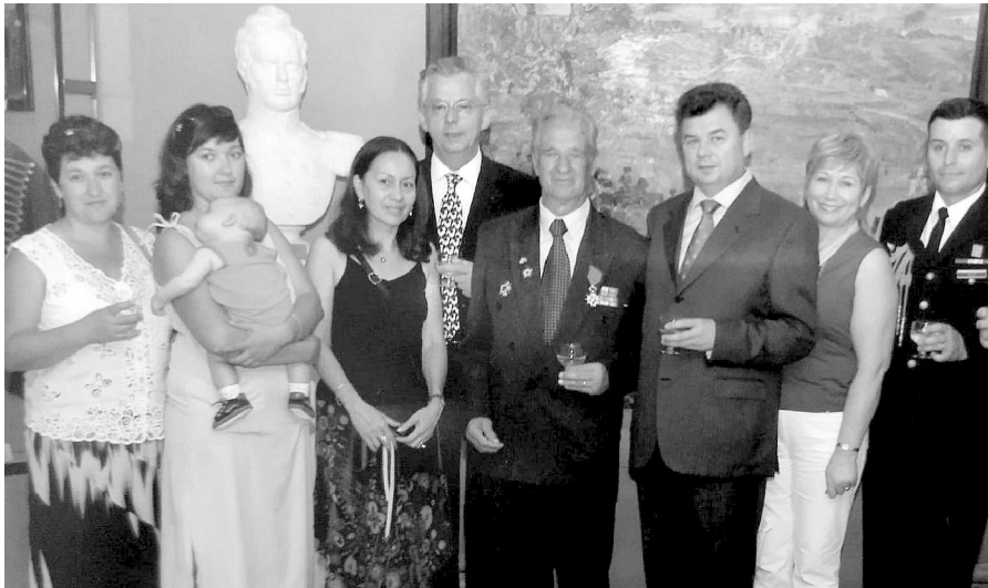
По случаю вручения ордена.