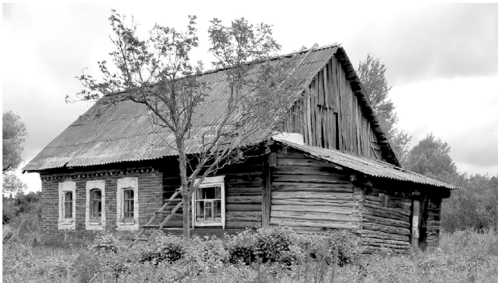
Тот самый дом в Рессете.