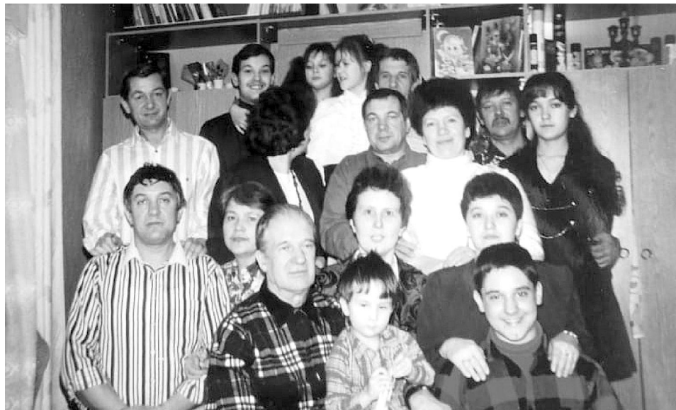
Многочисленное семейство Ерёминых.

Наталья АНДРОСОВА.