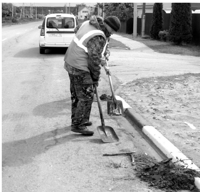
Сезонные работы выполняют работники ДРСУ.