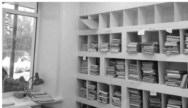
А это кабинеты Еленской участковой больницы. Красивые и отремонтированные.