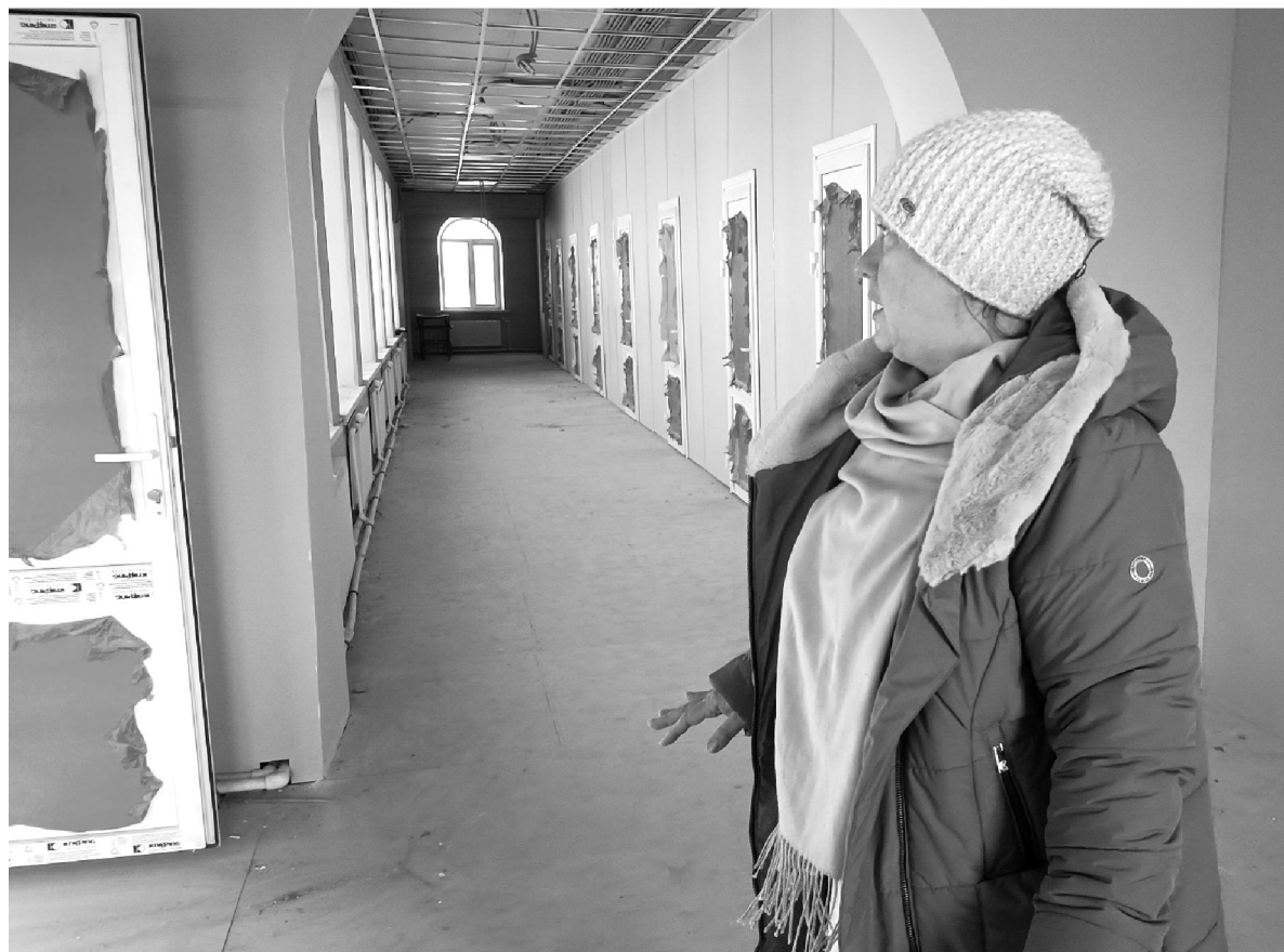
Вот так пока выглядит коридор поликлиники. Работы предстоит ещё много.

* * * "Подходит к завершению и капитальный ремонт внутри здания Еленской участковой больницы, который проводит ООО СК "Партнёр". В здании больницы полностью заменена система канализации,