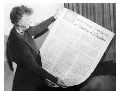
На фото: Элеонора Рузвельт с декларацией прав человека.

В 1948 г. 74 года назад, Организация Объединённых Наций приняла Всеобщую декларацию прав человека.