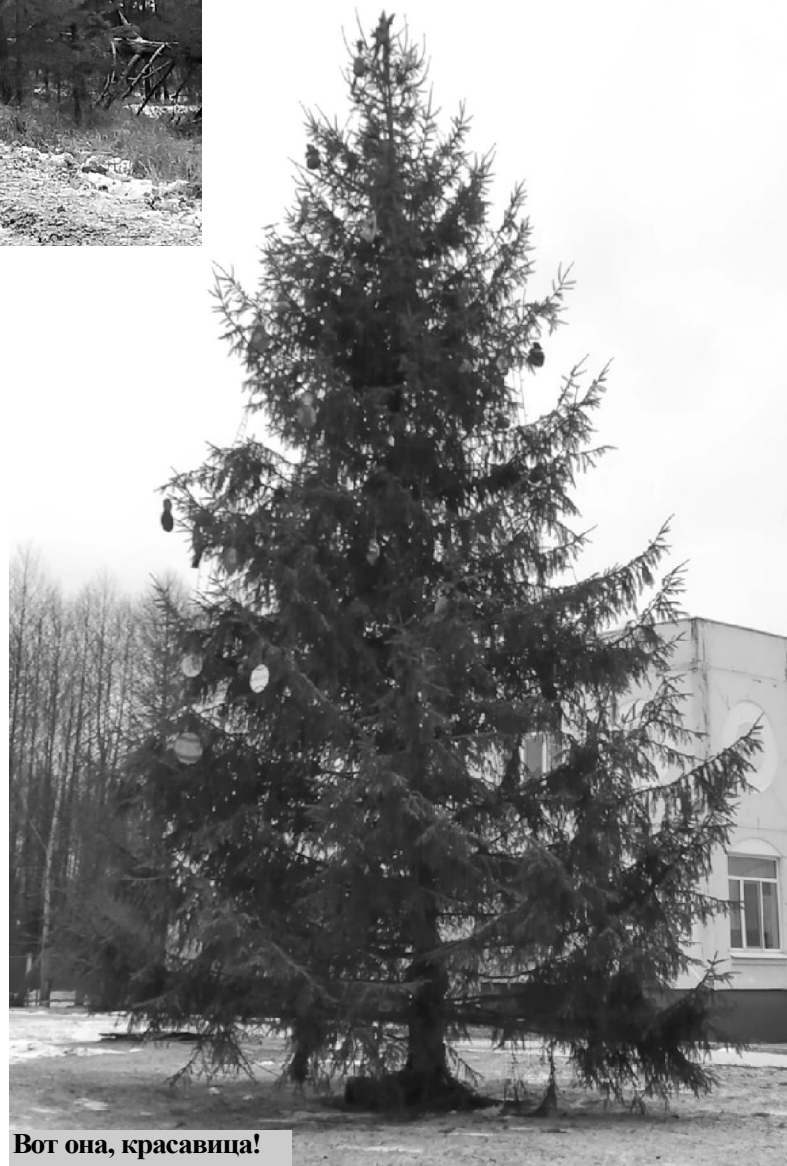
Вот она, красавица!

Но, конечно же, это вовсе не означает, что праздника в по-