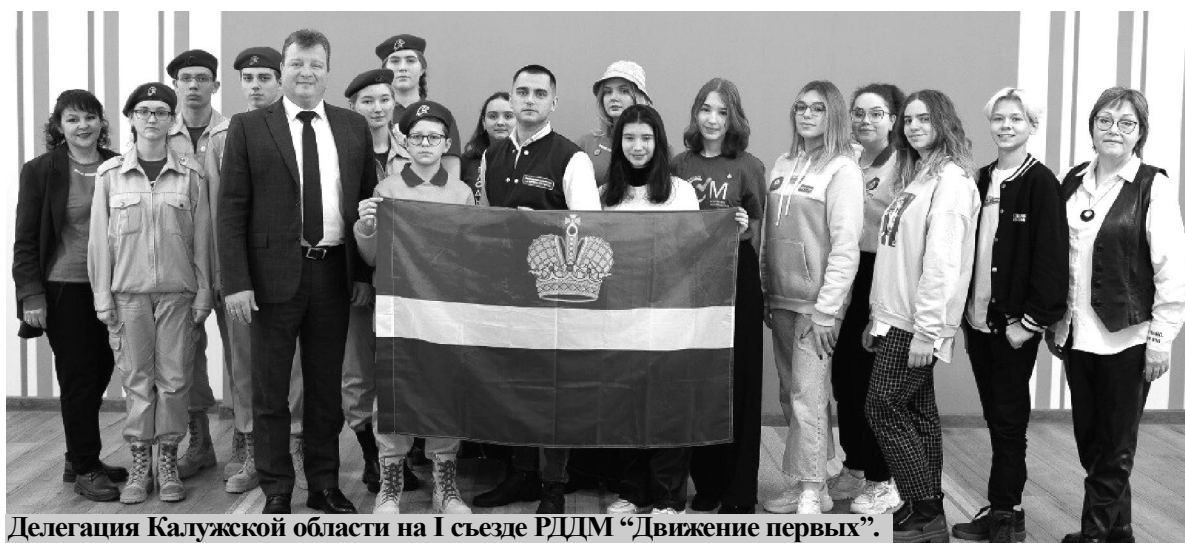
Делегация Калужской области на I съезде РДМ "Движение первых".

После этого на голосование вынесли пять вариантов, которые могли быть частью нового названия - "Пионеры", "Движение первых", "Движение имени Гагарина", "Новое поколение", "Юность". По итогу, большинство голосов отошло названию "Движение первых". Теперь новая общероссийская организация называется так: Российское движение детей и молодежи "Движение первых".