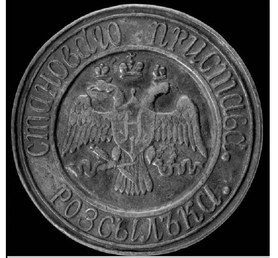
Печать становой приставы.

На территории Хвастовичского стана располагались: