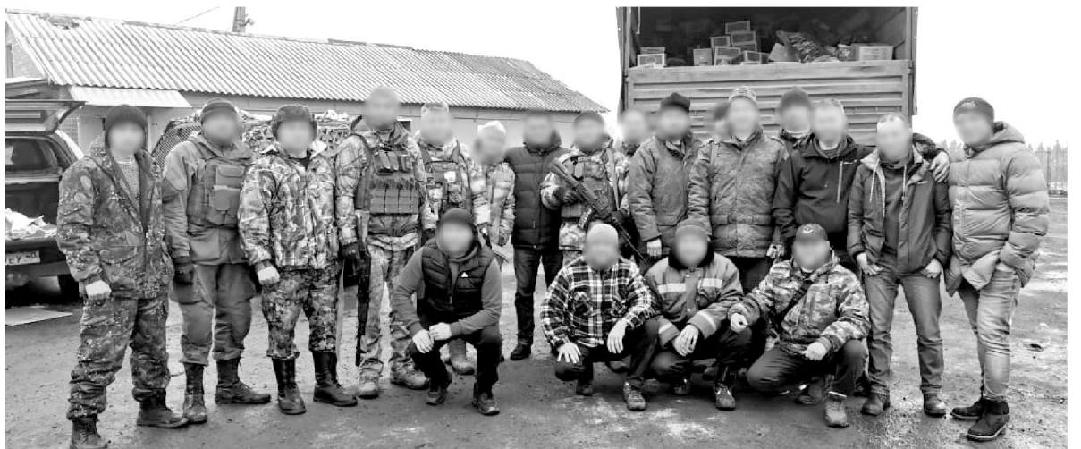
Подготовила Ольга ПОМОЗИНА.